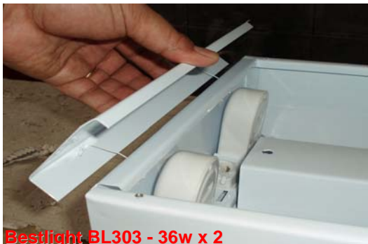
Bestlight BL303 - 36w x 2